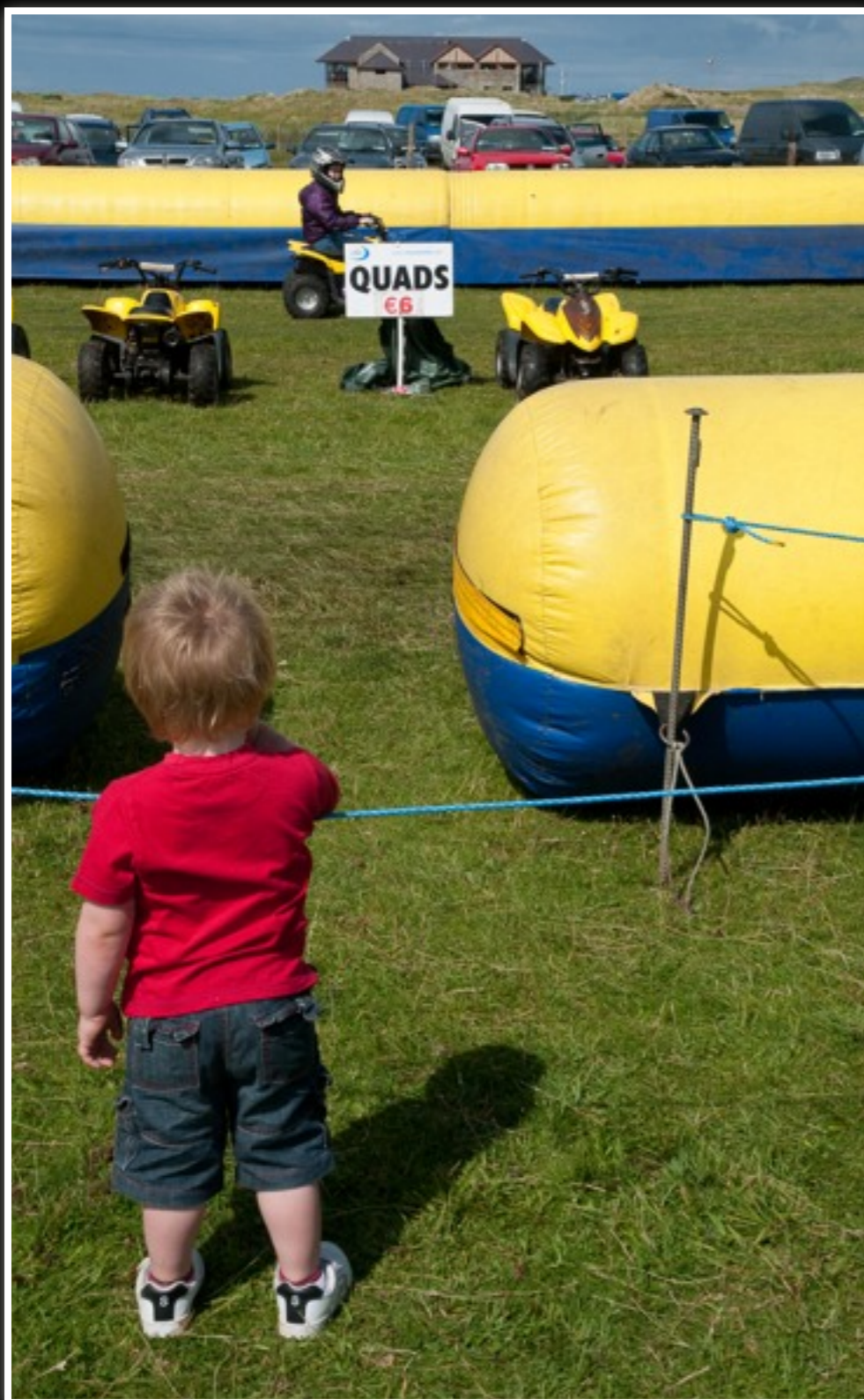
Later als ik groot ben .....