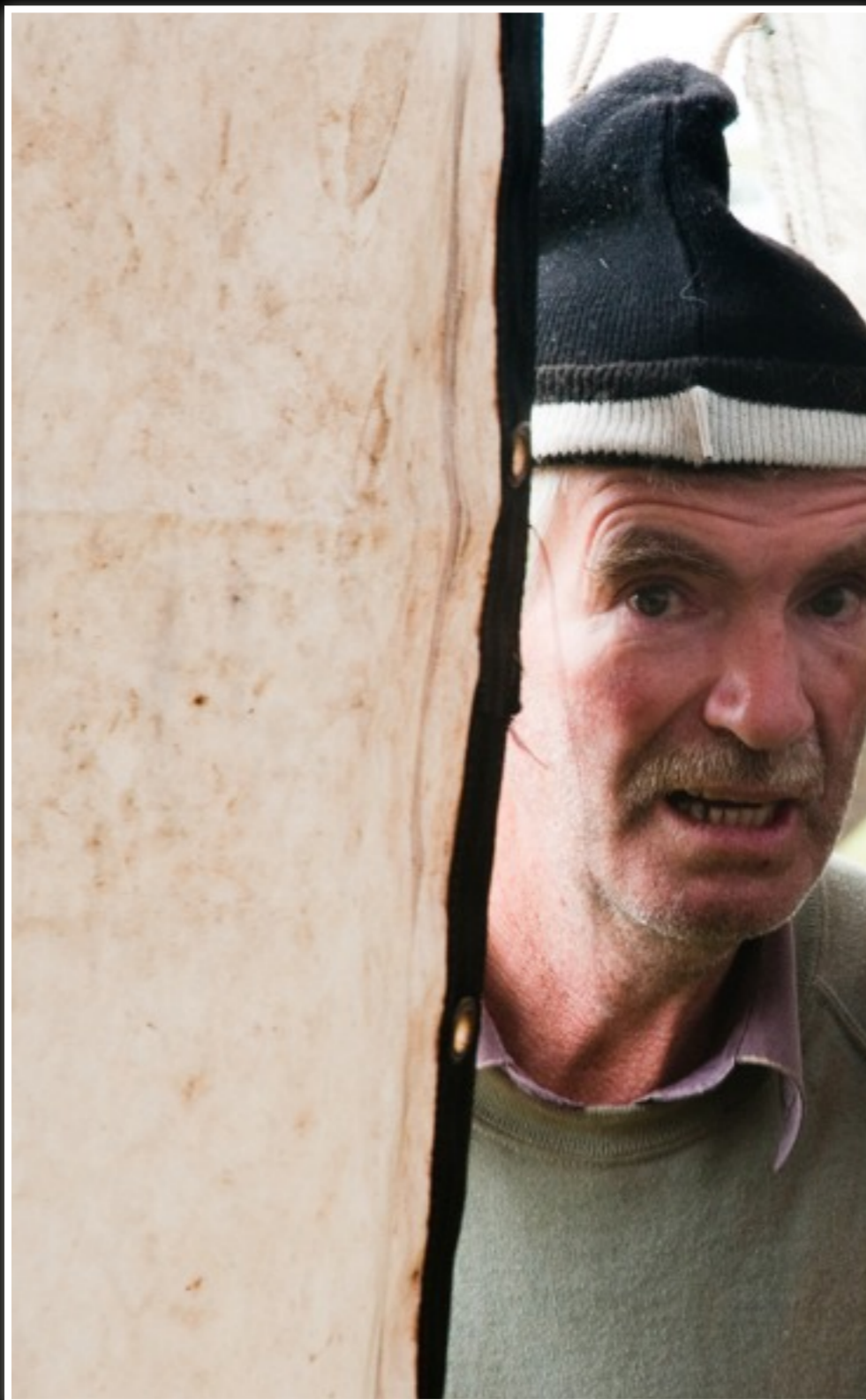
Op de show, gluren in een tent.